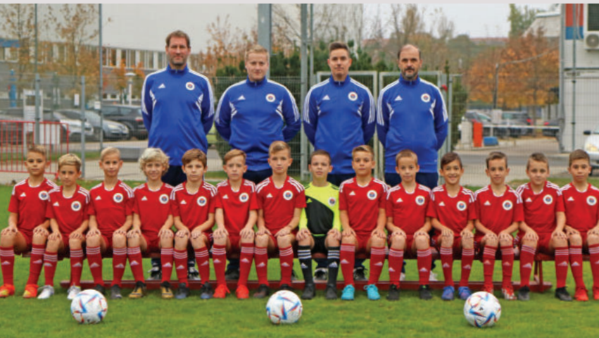
VASAS KUBALA AKADEMIA U10