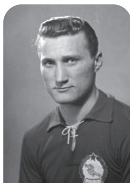
MACHOS FERENC (1932–2006)

A Tatabánya, a Szeged, a Bp. Honvéd és a Vasas egykori kiváló labdarúgója volt. 1955 és 1963 között 28-szor szerepelt a válogatottban és 12 gólt szerzett. A kispesti csapattal 1954-ben és 1955-ben, az angyalföldivel 1961-ben, 1962-ben és 1965-ben nyert bajnoki címet. 1955-ben gólkirály lett.