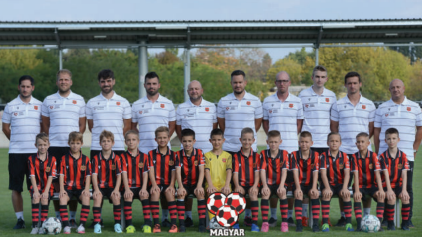
B.P. HONVÉD FC U10