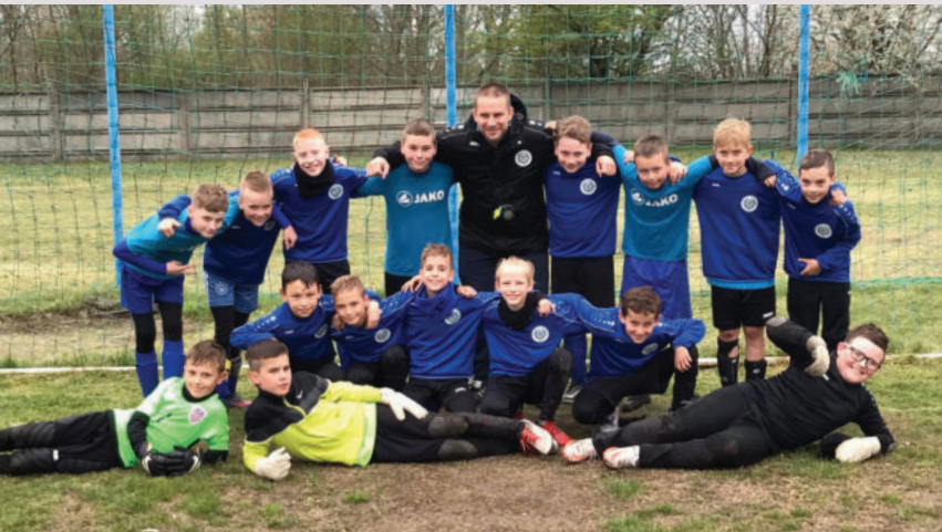
TATABÁNYAI SC U10